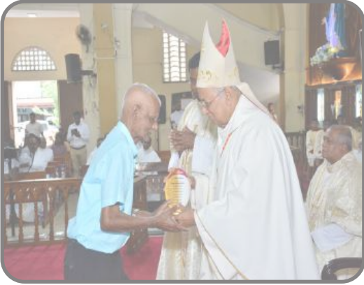
'භක්ති ප්‍රබෝධනය' එකසිය විසිපස් වසක වර්ෂාහිමාන මහෝත්සවයේ දී එතුමා උපහාර ලද මොහොත

සැබෑ කිතුනු අනුගාමිකයකු, විද්වතකු, නිහඬ හා සරල දිවි පෙවෙතක් ගත කරමින් ආදර්ශය සැපයූ අබේකෝන් සුරින් නොබෝදා අපෙන් වෙන්ව ගියේ ශ්‍රේෂ්ඨත්වයට හිමිකම් ලබමින්. නිදහස් අධ්‍යාපනයේ අනුභවය ලැබ පේරාදෙණිය විශ්වවිද්‍යාලීය වරම් ලැබූව ද, ප්‍රවේශය ලබා ගන්නට නොසිතූ ඔහු, වෘත්තීයමය වශයෙන් ශ්‍රී ලංකා තැපැල් සේවයට බැඳී තැපැල් ස්ථානාධිපතිවරයකු ලෙස වච්චියාව, නුවරඑළිය සහ කොළඹට සේවාව දෙන ලදී. විශ්‍රාම යාමෙන් පසුව මහනුවර සාන්ත අන්තෝනි විදුහලේත්, කොටහේන සාන්ත බෙනඩික් විදුහලේත් ඉගැන්වීම් කටයුතු වල නිරත විය. 'ඥානාර්ථ ප්‍රදීපය' පුවත්පත මගින් විරාක් කාලයක සිට 'සුඛස්' තුළින් නිවැරදි සිංහල කියා දෙන්නට යොමු වූ මෙතුමා, පාලි, සංස්කෘත, ලතින්, ඉංග්‍රීසි හා මව්බස පිළිබඳ මනා දැනුමකින් පුර්ණත්වය ලබා සිටි පඬිවරයෙකි. එතුමා 'භක්ති ප්‍රබෝධනය' සඟරාවේ සෝදුපත් බලන්නට දායක වෙමින් අමිල කාර්යභාරයක් ඉටුකරනු ලැබුවේ හෘදයාංගමව යි. ඒ වනාහි ප්‍රබෝධනය යුග මෙහෙවරෙහි රනින් ලියවෙනු නො අනුමාන යි. අපටත් නිවැරදි සිංහල හොඳින් දැන ගන්නට ඒ තුළින් ලද භාග්‍යය වෙනුවෙන් එතුමට අපි ණයගැති වෙමු. මෙවන් යුගයක ඔබතුමන්ගේ වියෝවෙන් ඇතිවන හිඩැස පිරවීම ලෙහෙසි පහසු කාර්යක් නොවන බව ශ්‍රී ලංකා කතෝලික සභාවට අවබෝධ වනු ඇත.