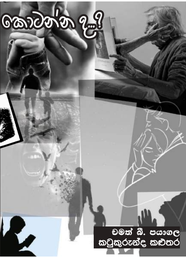
වමන් බී. පයාගල කටුකුරුන්දෙ කළුතර