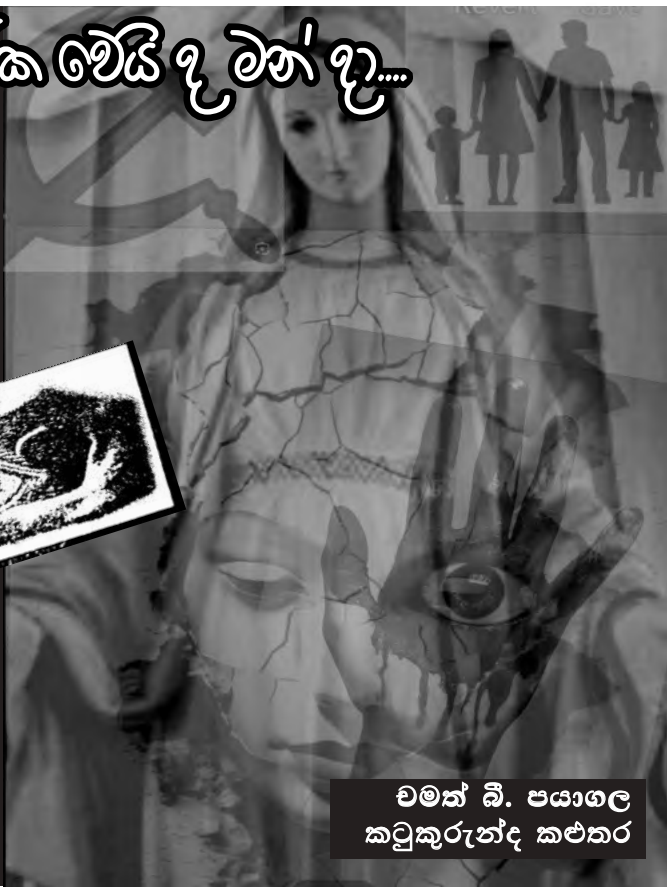
මමත් බී. පයාලෙ කටුකුරුන්ද කළකර